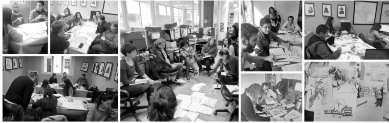
Imagen 2. Capacitación y trabajo equipo técnico de proyectos.

Durante 2018 y 2019 trabajamos en la localidad de Villa de Mayo, con familias de los barrios a partir de un primer proceso en la Unidad Local de Gestión, y en procesos en las mesas de los barrios San José y Parque Alvear de esa localidad. En los distintos procesos, realizamos 63 entrevistas a familias, junto a 56 relevamientos de viviendas, que nos posibilitaron conocer las condiciones físicas, ambientales e infraestructurales que presentan las viviendas y los espacios comunes, y poner en relación con los deseos y las necesidades socio espaciales.