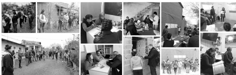
Imagen 3. Proceso de trabajo Barrio Parque Alvear.

Se trata de un trabajo conjunto en la problematización y proyección del espacio, a partir del relevamiento de las preexistencias físicas y sociales donde se plasman las situaciones que operan en la realidad, a partir de las cuales se construyen los problemas que tienen asidero en la población. El abordaje de las diferentes escalas y dimensiones, así como el trabajo con los distintos actores que inciden en el espacio, permite profundizar en un proyecto situado