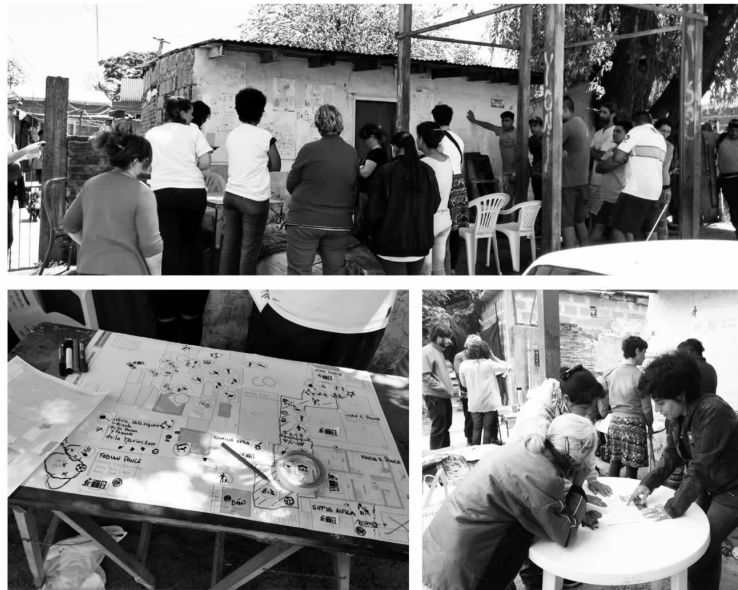
Imagen 1. Taller colectivo Barrio San Jose.

Sobre este acuerdo constituimos un equipo para trabajar conjuntamente con la población, en donde el aporte de Proyecto Habitar radica en dos aspectos: